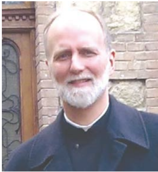
О. Борис Гудзяк

УКУ – це Український Католицький Університет, який вимріяли Митрополит Шептицький й Патріарх Йосиф ще з початку 20 століття. В Україні він не міг тоді реалізуватися з політичних причин. І Патріарх Йосиф створив його 1963 року у Римі. В 1990-их роках він розвинувся у Львові як єдиний католицький університет у колишньому Радянському Союзі. І правдоподібно це взагалі єдиний християнський приватний університет